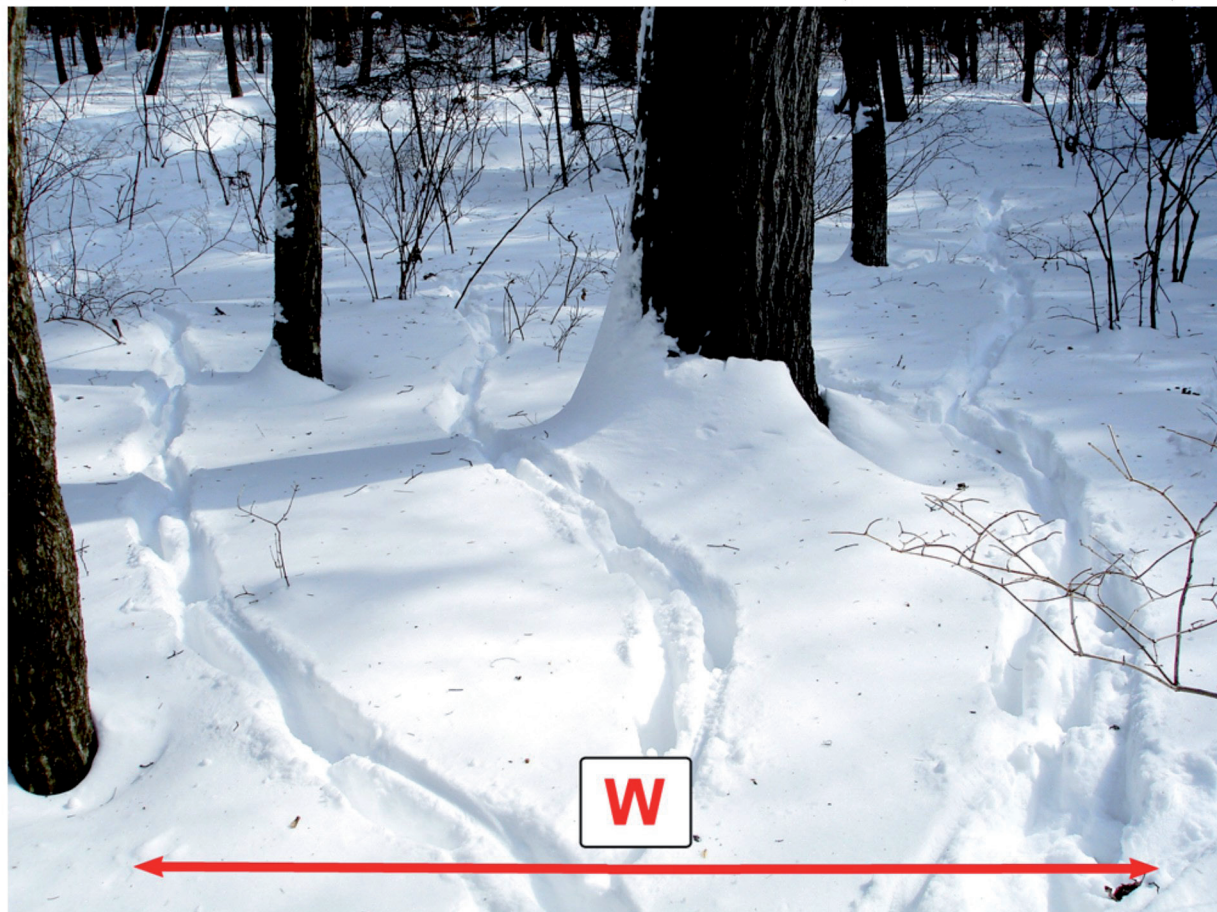
Определение ширины кормовой полосы у группы пятнистых оленей на территории Уссурийского заповедника.