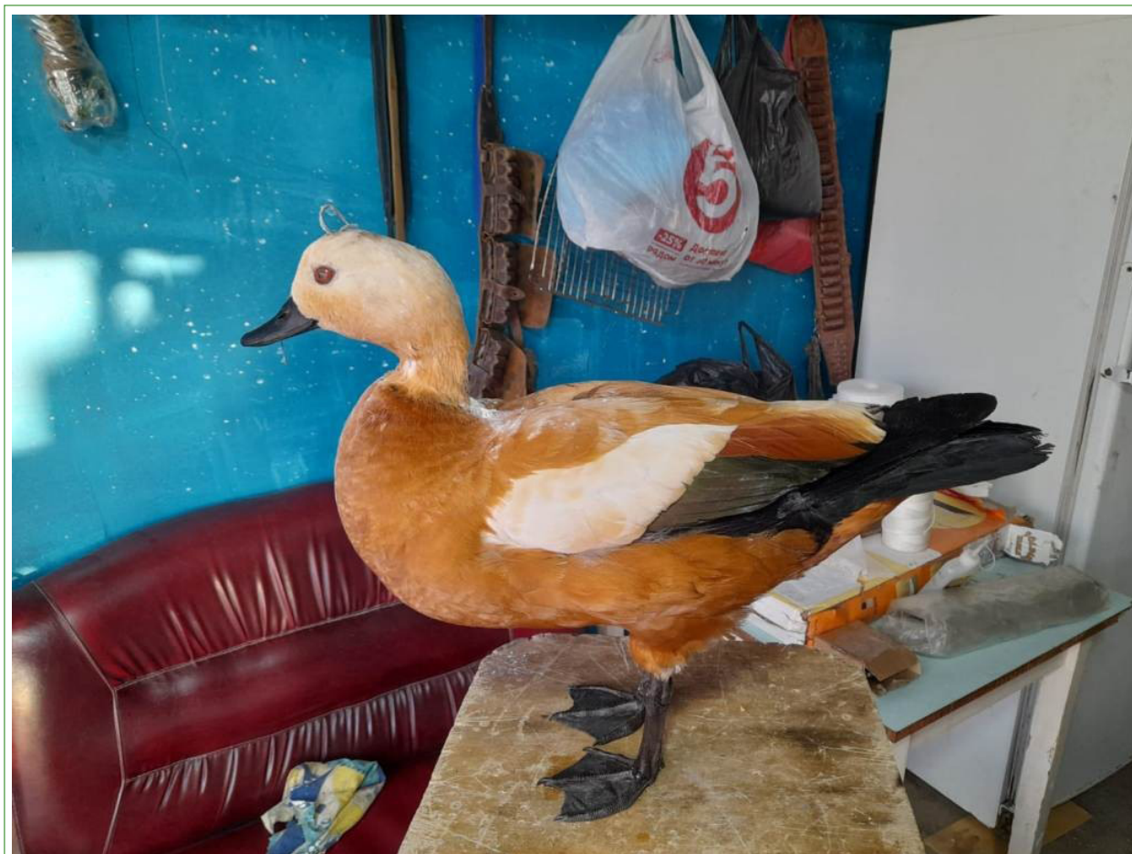
Рис. 7. Чучело огаря Tadorna ferruginea, добытого в окрестностях г. Амурск, 18.10.2025.