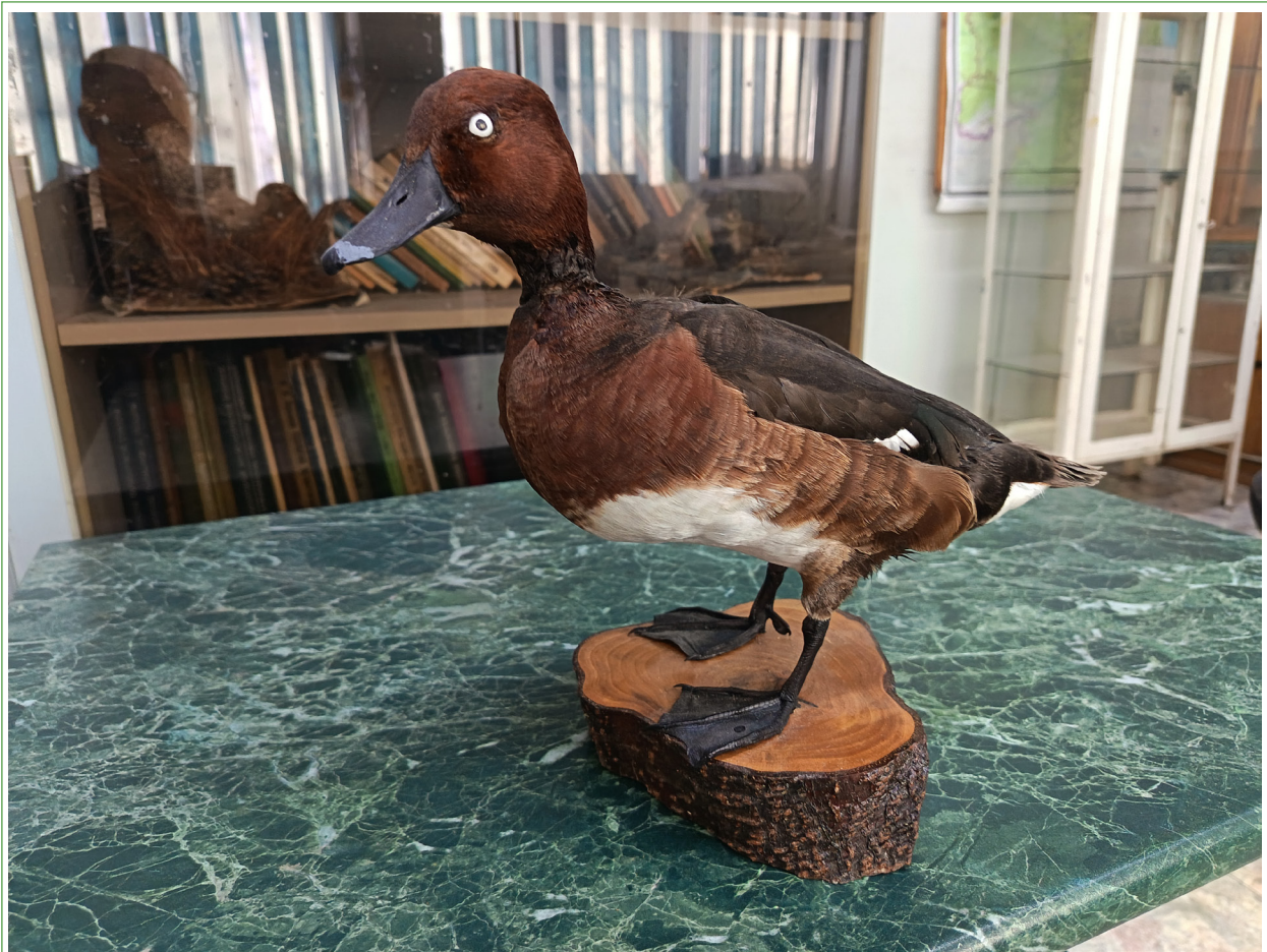
Рис. 10. Чучело самца белоглазого нырка Aythya nyroca, добытого в пригороде Амурска, 10.05.2025.