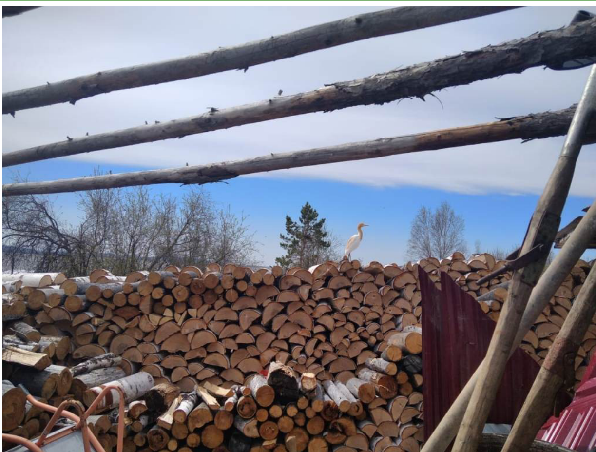
Рис. 1. Египетская цапля Bubulcus ibis в с. Чля (Николаевский район), 22.05.2024.