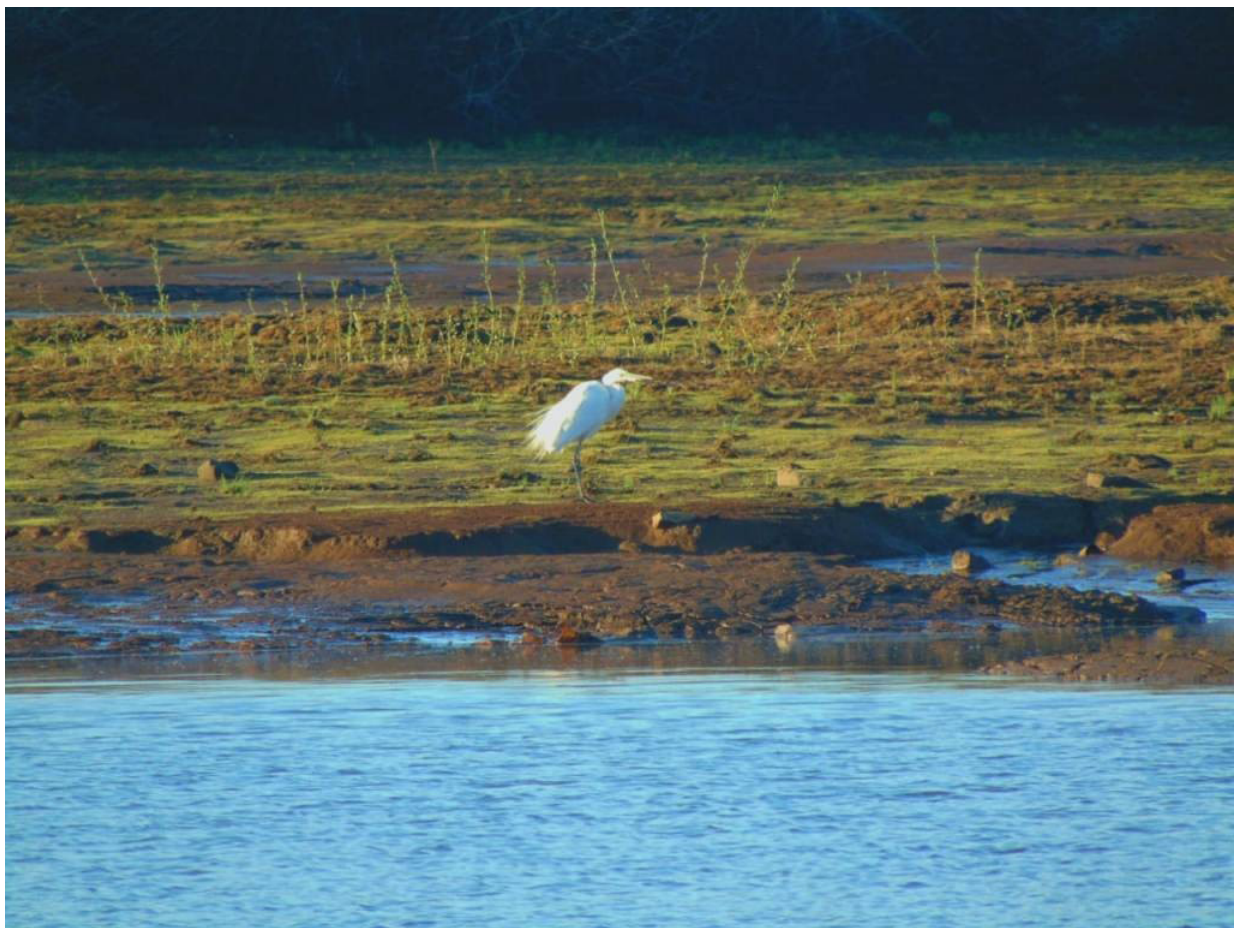
Рис. 2. Большая белая цапля Casmerodius albus на окраине с. им. Полины Осипенко.