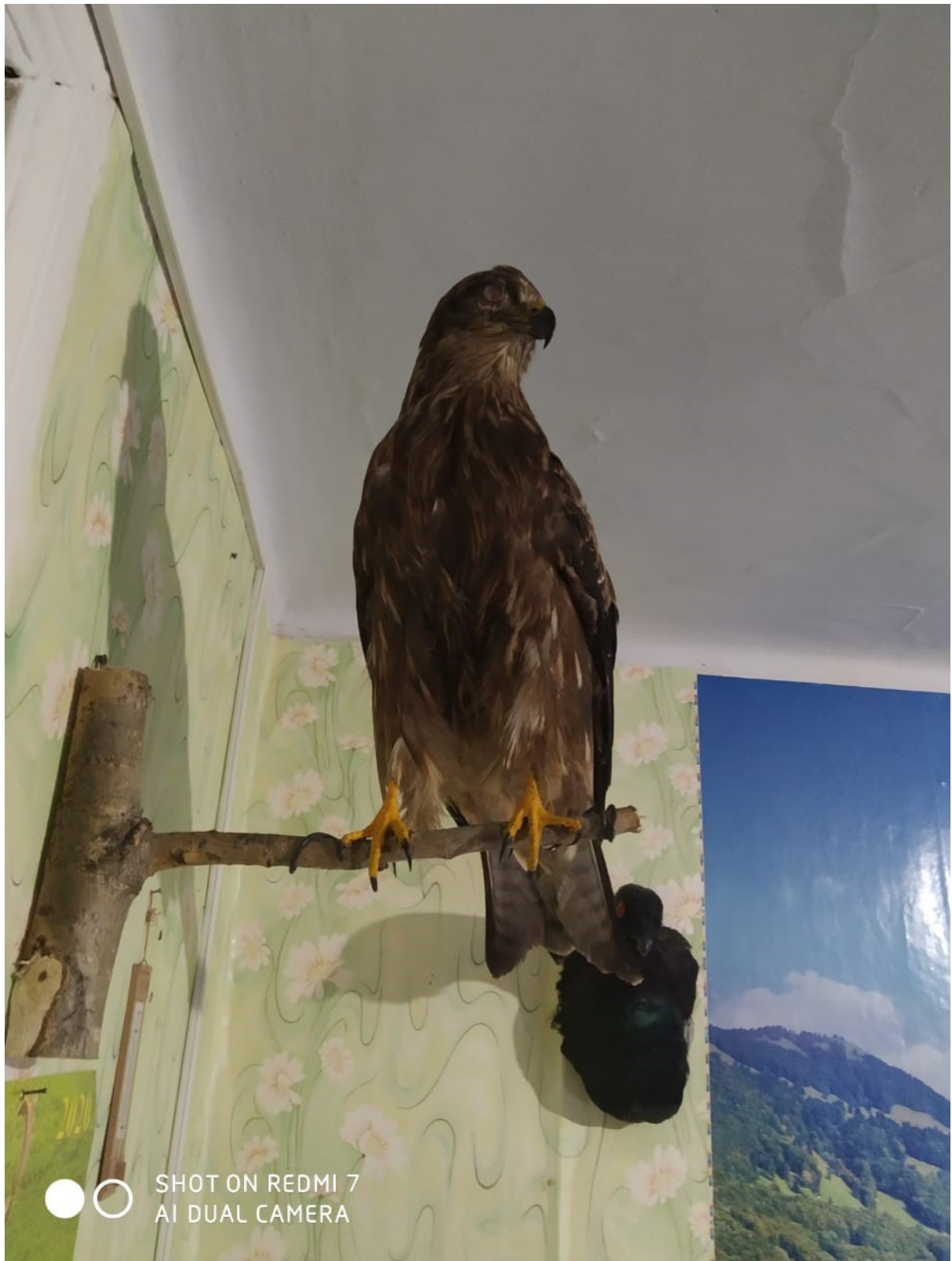
Рис. 12. Чучело черного коршуна Milvus migrans , добытого в п. Охотск в сентябре 2020 г. Экспозиция охотского краеведческого музея.