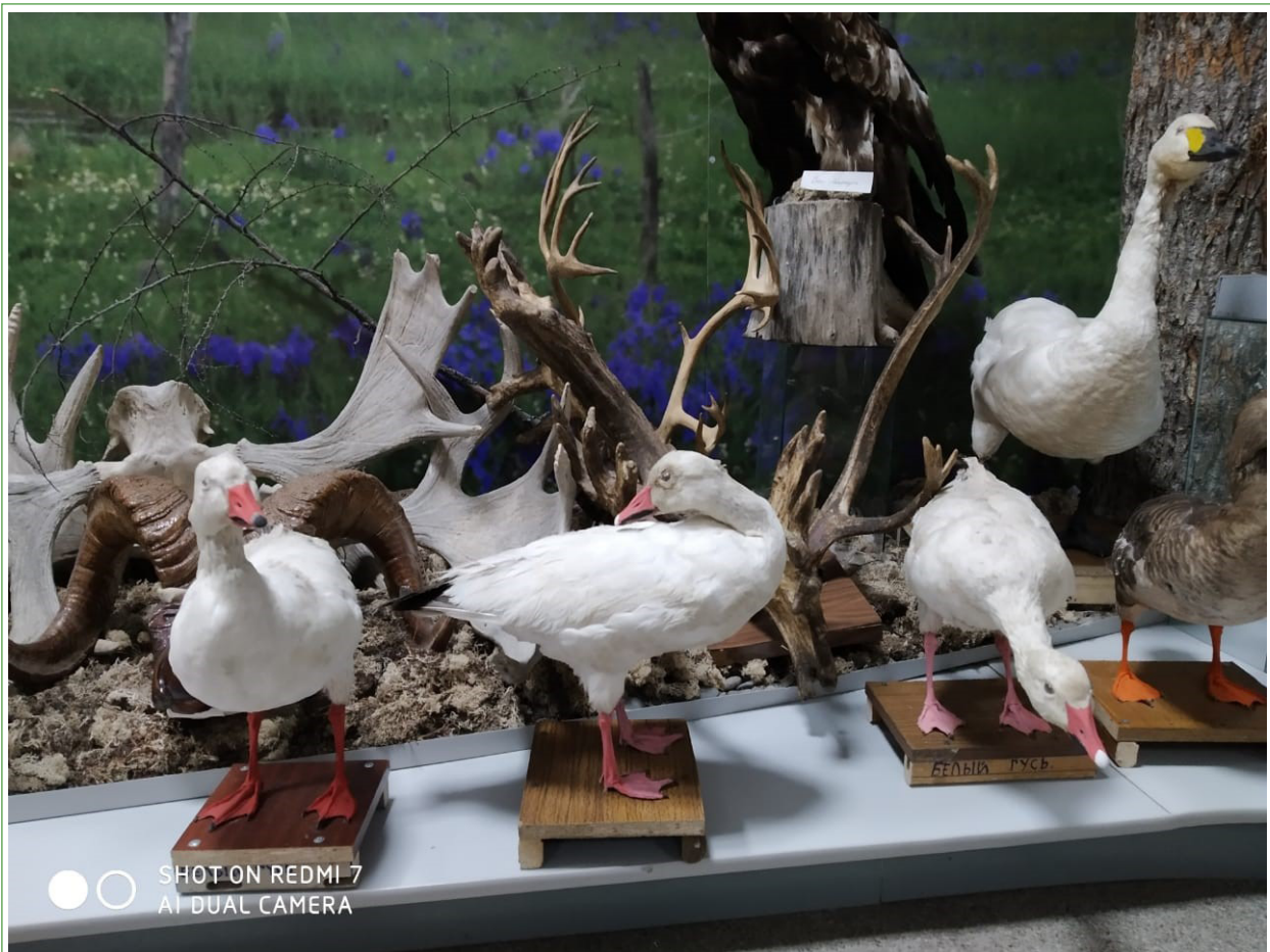
Рис. 4. Три чучела белого гуся Anser caerulescens . Экспозиция Охотского краеведческого музея.