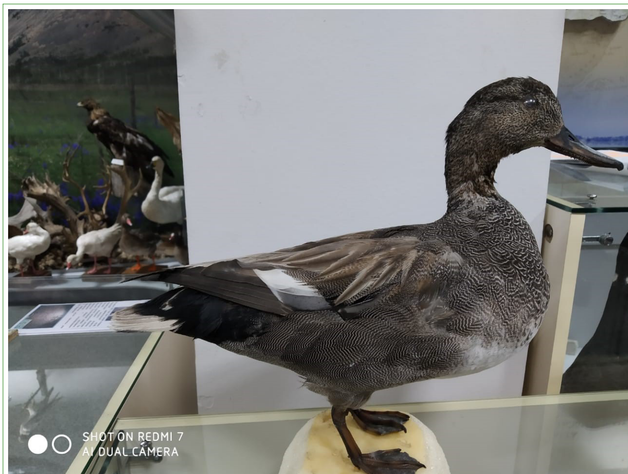
Рис. 9. Чучело серой утки Anas strepera , добытой в середине мая 2017 г. на р. Чильчикан. Экспозиция Охотского краеведческого музея.