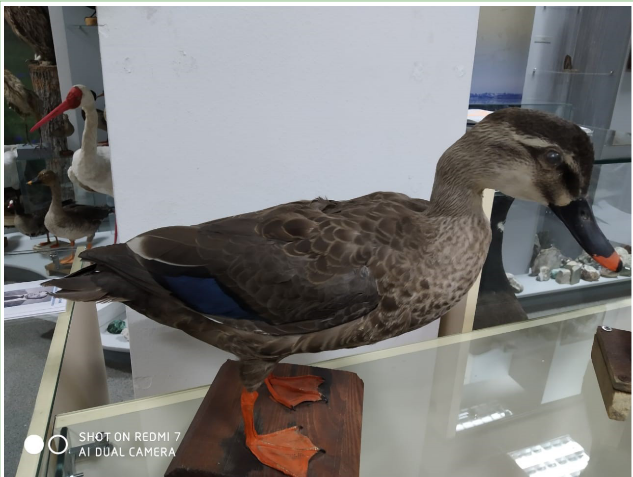
Рис. 8. Чучело черной кряквы Anas poecilorhyncha, добытой в окрестностях п. Охотск, 27.09.2007.