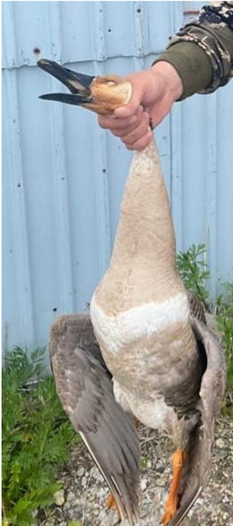
Рис. 6. Сухонос Anser cygnoides, добытый в окрестностях п. Охотск, 02.07.2023.