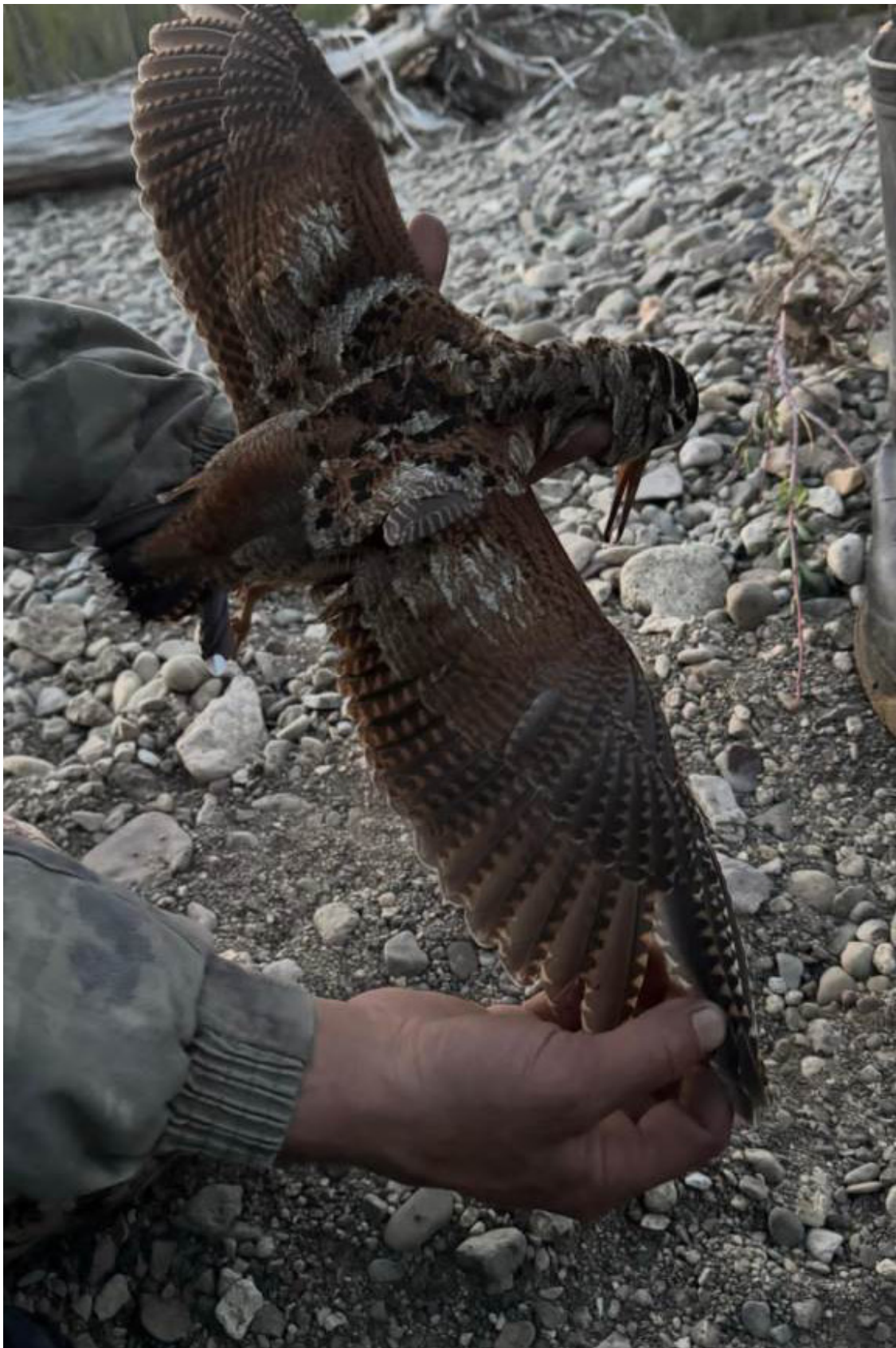
Рис. 13. Вальдшнеп Scolopax rusticola, добытый на р. Охота 01.06.2025.