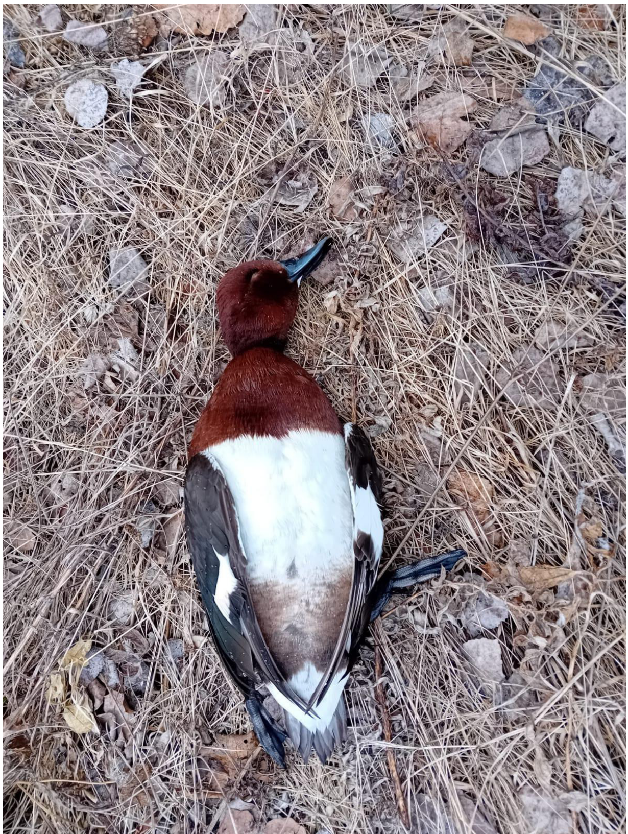
Рис. 11. Самец белоглазого нырка Aythya nyroca, добытый в окрестностях с. Смирновка (Хабаровский район) 25.09.2025.