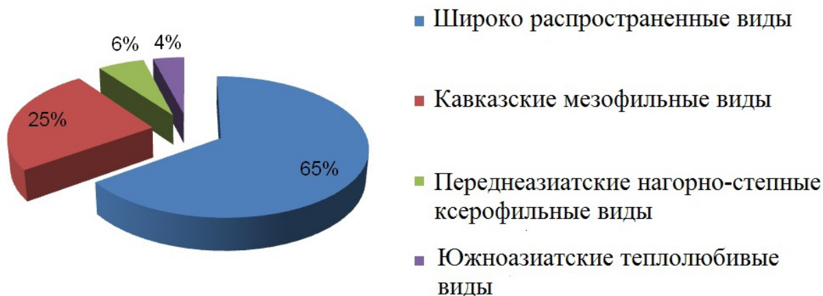
Рис. 3. Эколого-фаунистические группы мелких млекопитающих Тляратинского заказника ГПЗ «Дагестанский»