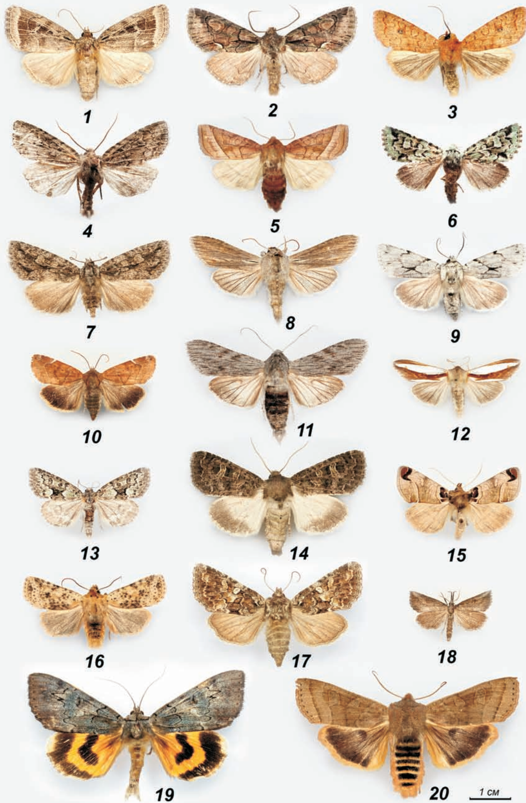
Новые и интересные виды совок с территории Омской области: 1 – Amphipyra sergei ; 2 – Allophyes oxyacanthae ; 3 – Agrochola circellaris ; 4 – Atrachea parvispina ; 5 – Hydraecia ultima ; 6 – Feralia sauberi ; 7 – Phidrimana amurensis ; 8 – Cucullia indieriensis ; 9 – Oncocnemis senica ; 10 – Cosmia affinis ; 11 – Cucullia pustulata ; 12 – Cucullia biradiata ; 13 – Victrix umovii ; 14 – Sidemia spilogramma ; 15 – Plusidia cheiranthi ; 16 – Conistra rubiginea ; 17 – Conisania literata ; 18 – Zekelita ravulalis ; 19 – Catocala bella ; 20 – Orbona fragariae .